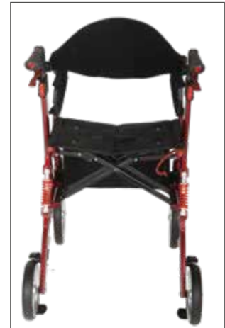
VARIO mit hochgeklappten Beinstützen