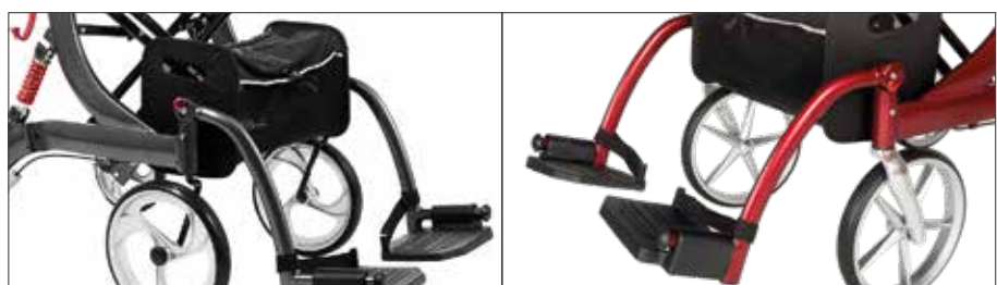
Fußstütze entsprechend Rahmenfarbe