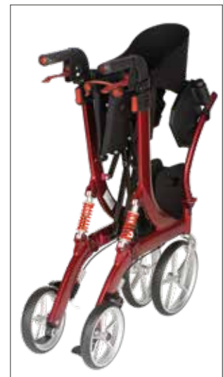
Faltmaß mit Fußstützen