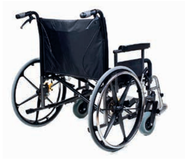
Abb. mit 200 x 50 mm Lenkräder

Jeder Mensch ist individuell. Auch in seinen Größen und Gewichten. Menschen mit hohem Übergewicht oder Adipositas Patienten benötigen als Unterstützung im Alltag besonders stabile Hilfsmittel. Wie im sogenannten Normalbereich auch, gibt es bei den XL und XXL Produkten bestimmte Kriterien, die eine größere Bandbreite abdecken können. Nicht jeder Schwerlastrollstuhl muss eine Maßanfertigung sein. Es gibt Produkte, die wie bei der Bekleidung auch auf die gängigen Körpermaße und Gewichte ausgelegt sind und dann passen wie angegossen.